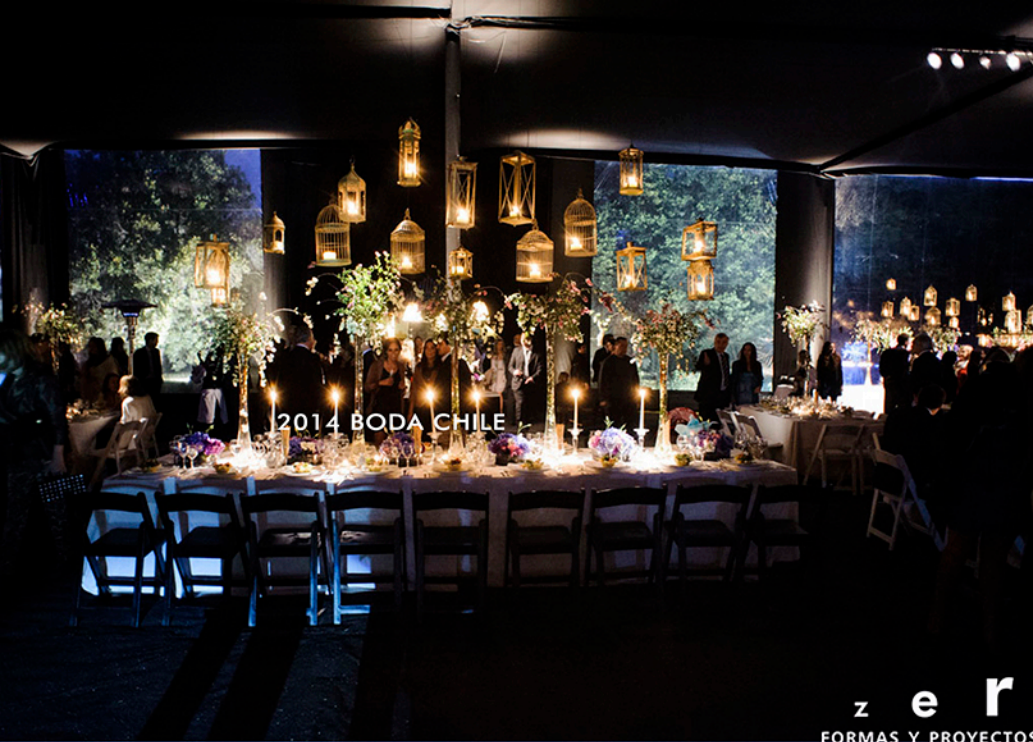
2014 BODA CHILE