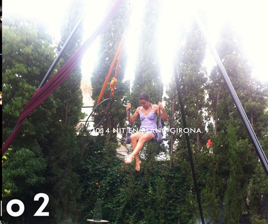
2014 NIT EN EL ANO GIRONA