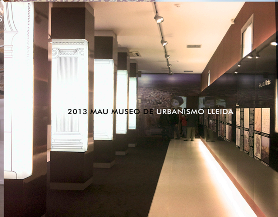
2013 MAU MUSEO DE URBANISMO LLEIDA