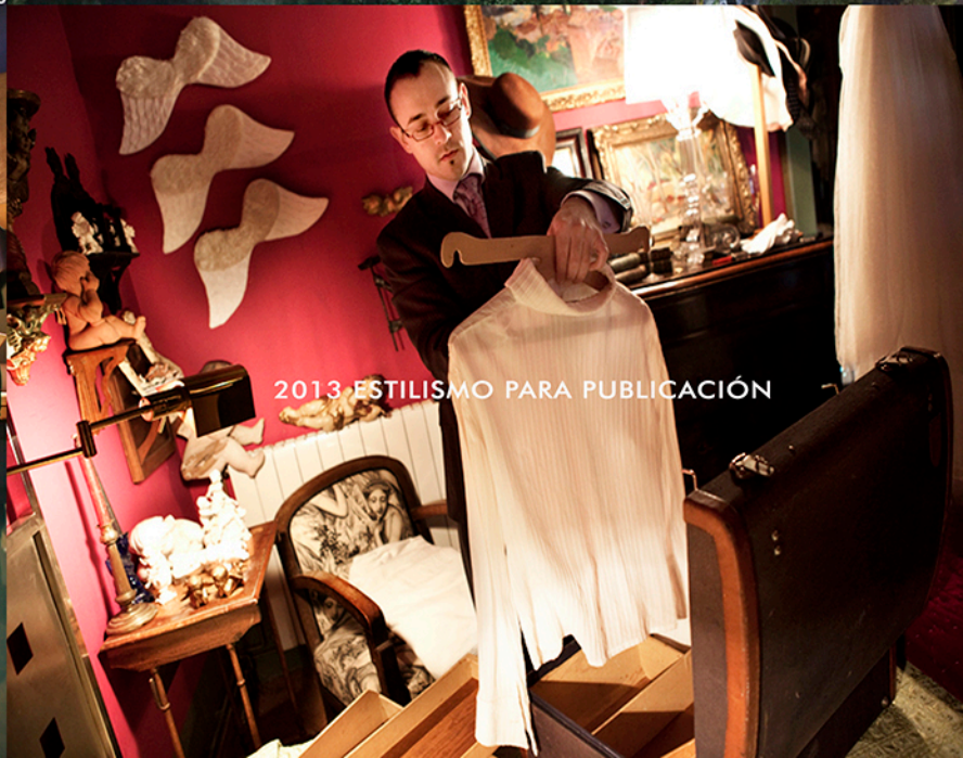
2013 ESTILISMO PARA PUBLICACIÓN