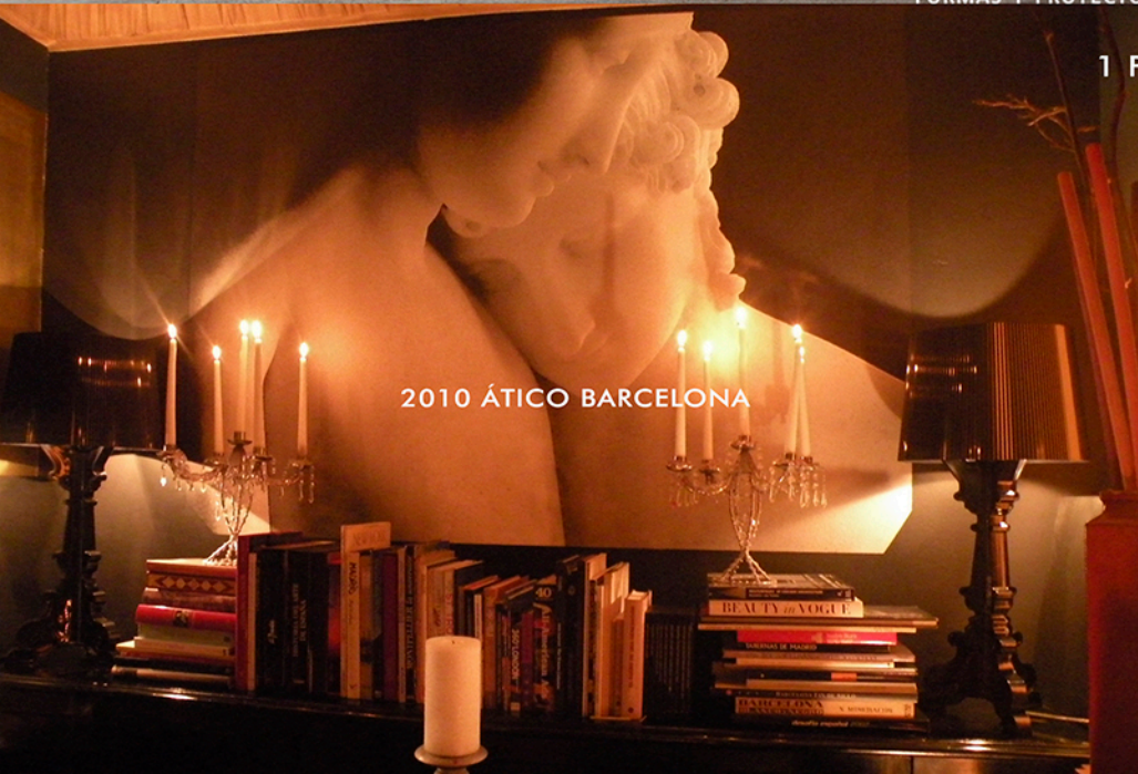
2010 ÁTICO BARCELONA