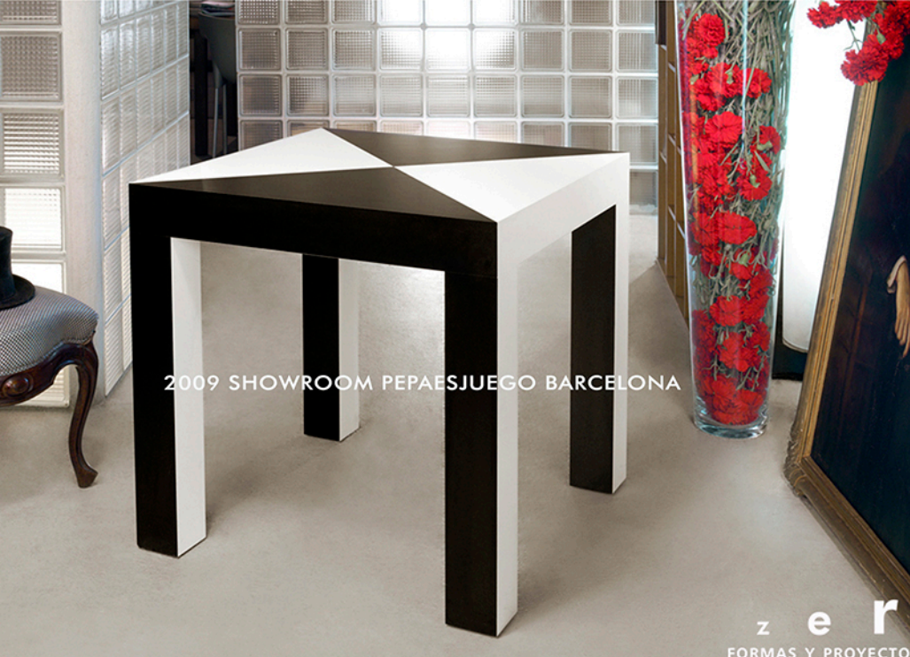
2009 SHOWROOM PEPAESJUEGO BARCELONA