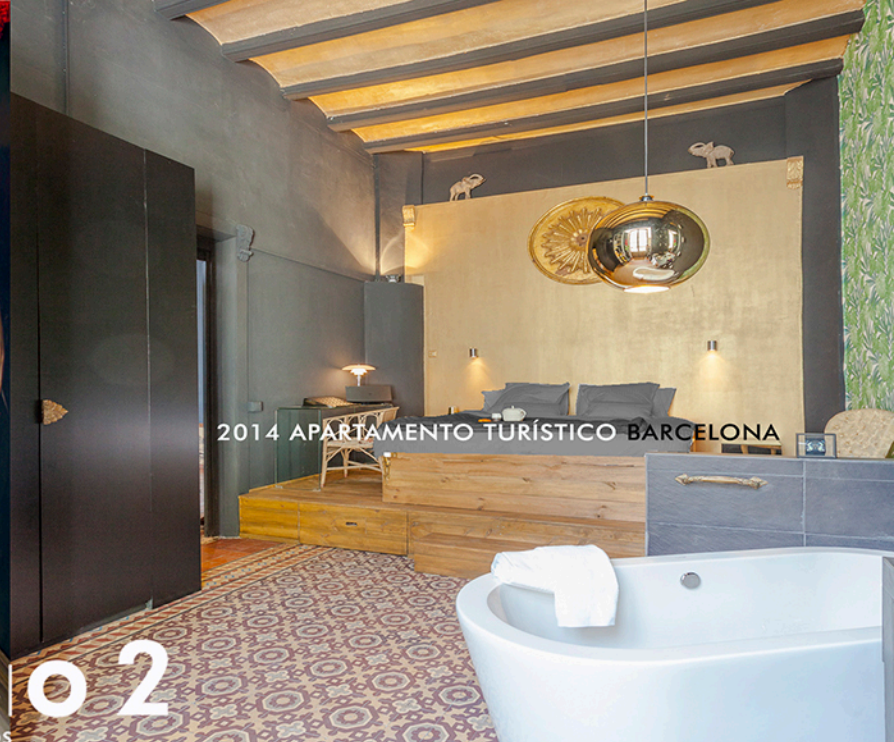
2014 APARTAMENTO TURÍSTICO BARCELONA