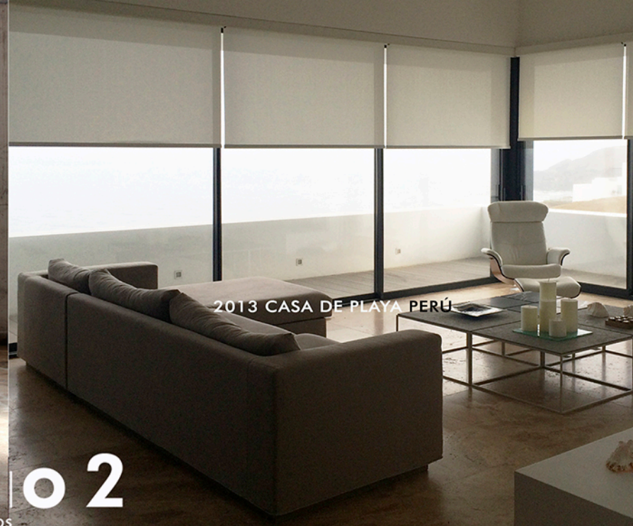
2013 CASA DE PLAYA PERÚ