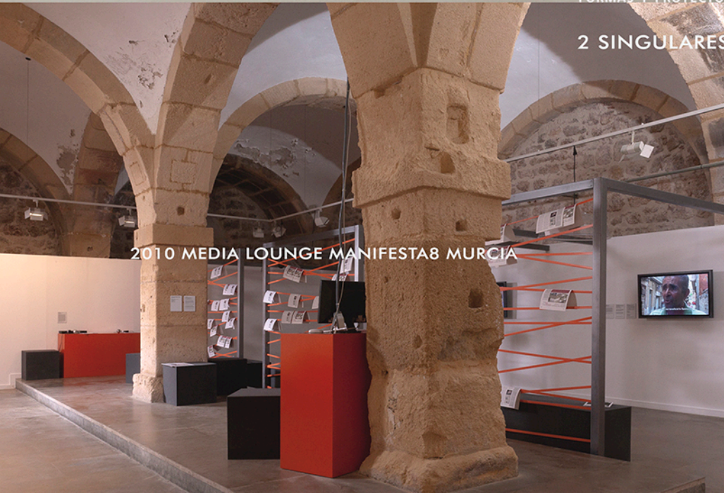
2010 MEDIA LOUNGE MANIFESTA8 MURCIA