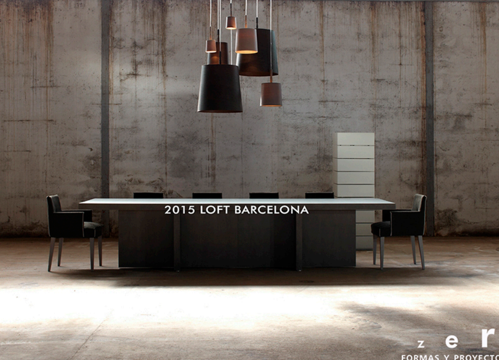
2015 LOFT BARCELONA